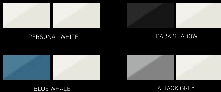
Carena e Coperta / Hull and Deck