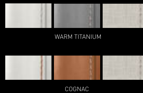
Selleria di coperta / Deck Cushions